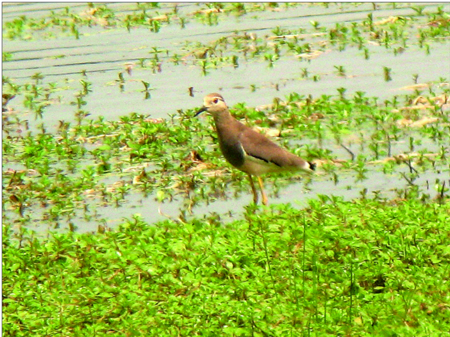
Vanneau à queue blanche photographié à Saint-Martin-de-Seignanx où il a stationné du 10 au 13/05, une première pour le bassin de l'Adour.