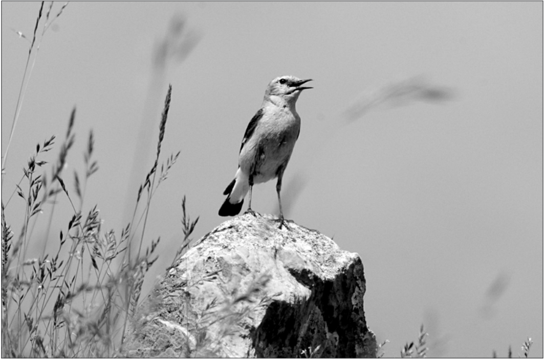
Femelle de Traquet motteux sur son site de reproduction au col du Pourtalet, à une altitude de 1800 m. L'espèce peut s'élever encore plus haut, régulièrement jusqu'à 2400 m, plus ponctuellement au-delà.

automnaux ont lieu le 11/10 à Ger (JIG) et le 27/10 à Anglet (APo) et Messanges (FCa).