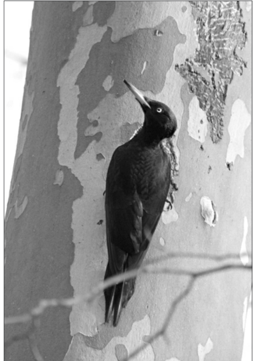
Largement répandu en plaine jusqu'au littoral, le Pic noir choisit alors notamment le platane pour creuser sa loge : une image de l'espèce bien éloignée de celle proposée par les individus de montagne....

Faucon hobereau Falco subbuteo (d=114) Les premiers retours sont notés les 5/04 à Trébons (DRa), 8/04 à Bours (SPé) et 11/04 à Puydarrieux (VDu). Sur le site de Trébons, jusqu'à 65 en 2 groupes le 17/04 (DRa). Aucune mention de