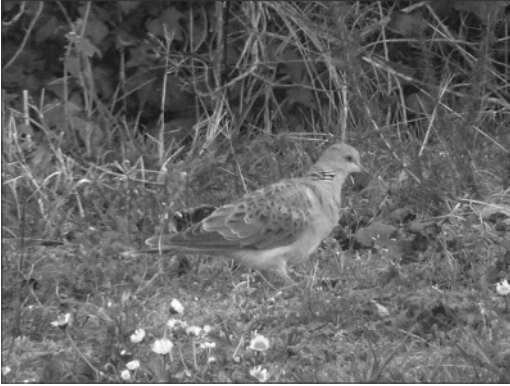
Tourterelle des bois de 1 er hiver observée du 19 au 27 février à Oloron-Sainte-Marie. Les données hivernales (décembre et janvier) sont rarissimes et celles de février peuvent également concerner des individus qui ont hiverné en Europe.

Quelques regroupements notables : 35 à Pontacq et 45 à Luquet le 8/11 (JIG), 38 à Ustaritz le 17/01 (XDa) et 54 à Vieux-Boucau-les-Bains le 9/02 (APo, XDa). Pour ce qui est de la reproduction, des coquilles d'œuf sont notées les 7/01 à Bénéjacq (JIG) et 16/03 à Saint-Aubin (PUT), la couvaison est observée le 13/04 à Anglet (FCa), des jeunes sont encore au nid le 14/07 à Saint-Aubin et volants le 10/07 à Audignon (PUT).