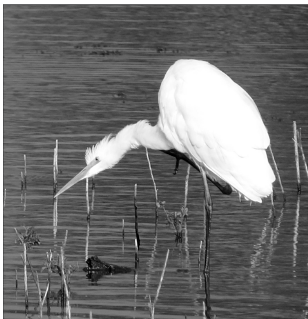
La Grande Aigrette s'attarde en nombre au printemps tandis que l'estivage se développe dans les sites les plus favorables, nouvelle étape vers une première reproduction.

Omniprésent toute l'année le long des côtes, les plus gros effectifs reportés sont de 200 le 5/11, 520 le 24/12 et 160 le 8/02 à Capbreton (FCa, GoL) et 365 le 5/10 à Tarnos (APo, PDV). Les classes d'âges notées révèlent un taux de 70 jeunes le 4/10 sur un total de 100 oiseaux (PDV). Un