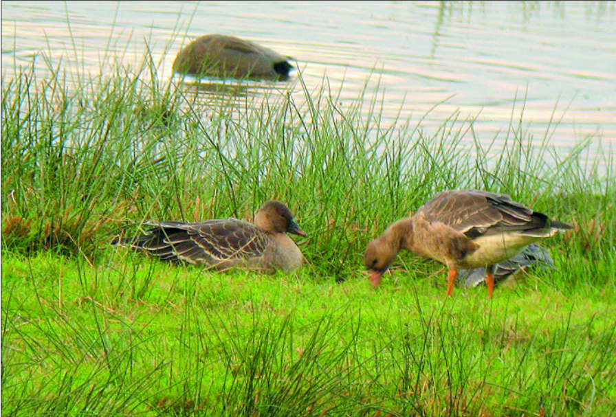
Oie des moissons de type rossicus (dénommée Oie de toundra, à gauche) et Oie rieuse photographiées à Saint-Martin-de-Seignanx le 17/11. Si l'Oie rieuse est régulièrement présente en petits effectifs, l'Oie des moissons est beaucoup plus rare, la dernière observation remontant au 24/10/2007 à Pontonx-sur-l'Adour.